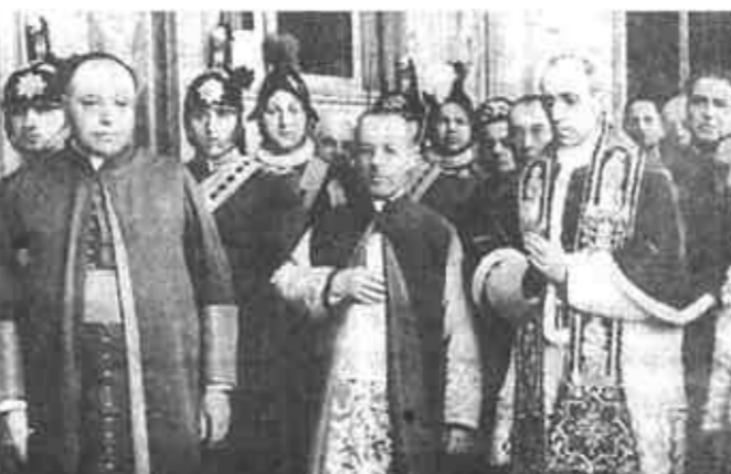
1939年8月12日,63岁的帕萨里加冕为教皇庇护十二世

如今,在国内消费市场上,“宫廷糕点”、“清宫保健品”、“宫廷御酒”等宫廷制品名目繁多,各厂家都费尽心思,将其产品来源说成是正宗“宫廷秘方”,有的酒厂还将其产品说成是地方晋献宫廷的贡品、清代某皇帝的御用酒。对此,中国第一历史档案馆专家于近日发表声明指出,至今还没有任何厂家或个人拿着自己产品的配方到该馆进行真伪鉴定。 中国第一历史档案馆是专门保存明、清两朝历史档案的国家档案馆。该馆研究人员指出,馆藏内务府御膳房档案中的糕点食品,都是有其名而无配料的制法过程。目前市场出售的“宫廷糕点”,只是徒有其名而已。此外,清代也不存在以酒作为贡品进献宫中的情况,因为在该馆的宫中贡单中,根本就没有酒类这一项。地方官员进贡给皇帝吃的东西除茶叶、水果和面以外,其它均为珠宝玉器、丝罗绸缎等,而清代以前的档案也没有保存下关于宫廷茶膳方面的记载。 既然最权威的国家历史档案馆里都没有记载,那么众多的“宫廷秘方”、“宫廷御用”是从哪儿来的呢?结论只有一个:是令人编造出来的,或说是“乱点鸳鸯谱”“点”出来的。也许有人会说,宫廷档案里没有记载,大概是当时从宫廷传到民间,由民间传下来的。如果真是这样的话,那么为什么不拿自己的产品配方到历史档案馆去鉴定一下真伪呢?既然没有经过权威部门鉴定或认可,怎么可以随意说是“宫廷”呢? 退一步讲,即使是有“宫廷秘方”之类,那“秘方”是否科学,是否符合现代人健康的需要,营养搭配是否合理也需研究。 说白了,某些厂家竭力把自己的产品与“宫廷”扯在一起,以所谓的“御用”来“镀金”,并“披”上“秘方”的“外衣”,使其产品蒙上一层不可言宣的“面纱”,这无非是一种蛊惑人心的宣传。(吕凤梅)