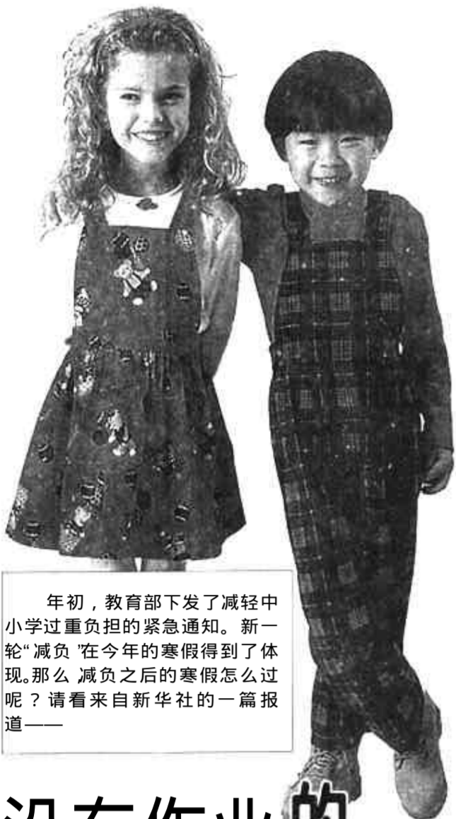
年初，教育部下发了减轻中小学过重负担的紧急通知。新一轮“减负”在今年的寒假得到了体现。那么，减负之后的寒假怎么过呢？请看来自新华社的一篇报道——