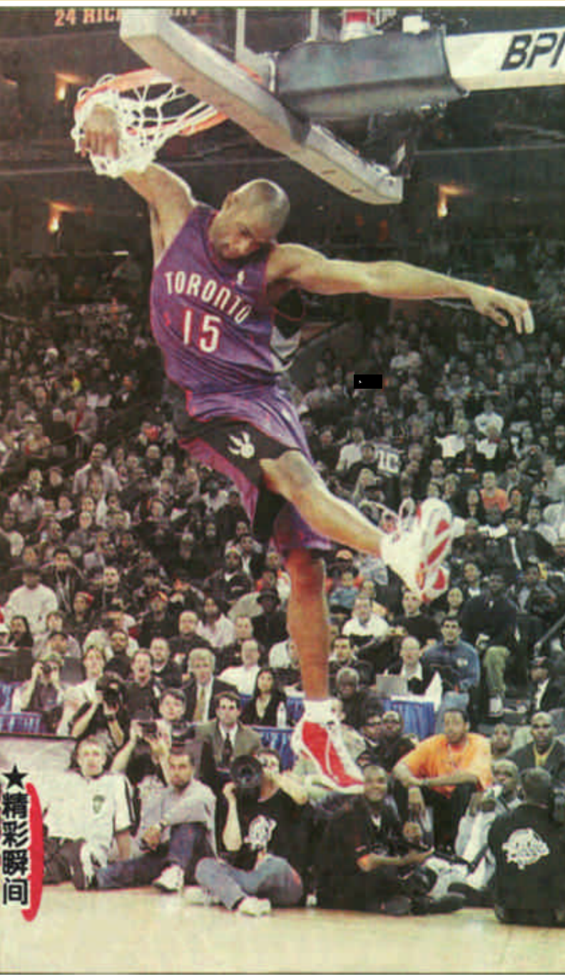
在决赛中，冠军得主多伦多猛龙队的文斯·卡特在空中飞跃扣篮后用小臂伸入篮圈把身体悬在空中。